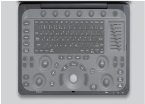
Película protectora impermeable