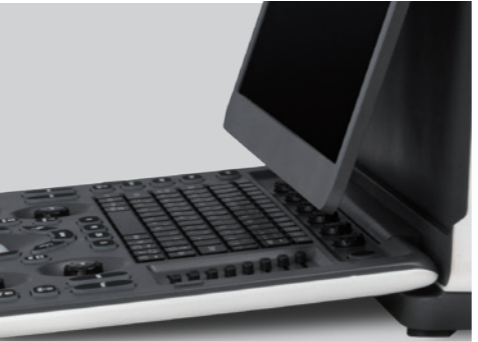
Monitor inclinable y panel intuitivo