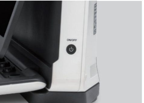
Tiempo de arranque rápido