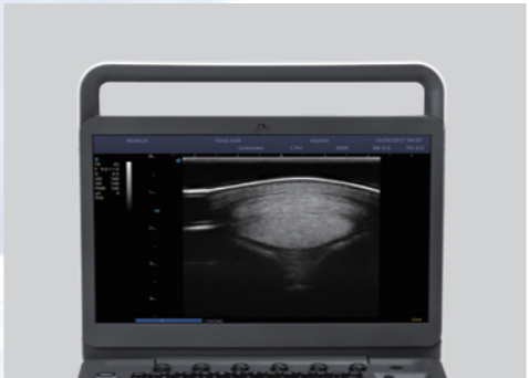
Monitor HD de 15,6 pulgadas